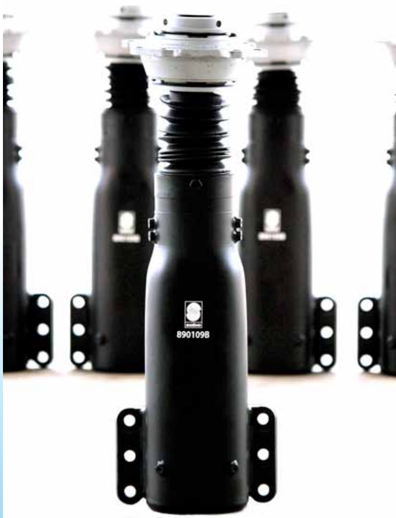
Il nuovo Sabo Rif. 890109B

La famiglia degli ammortizzatori Sabo si è arricchita di un importante prodotto, che la Roberto Nuti Spa fornisce, fra i pochissimi in Europa, in pronta consegna, a conferma dell'attenzione dell'azienda al completamento della gamma. Si tratta dell'ammortizzatore anteriore per Iveco 380 e Iveco Euroclass. Il dispositivo è stato progettato dall'ingegner Luigi Angelo Morra ed è un cosiddetto prodotto di sicurezza, il cui buon funzionamento è determinante per il governo del veicolo e per la sua tenuta di strada. Per questo motivo il prodotto è costruito seguendo una specifica normativa internazionale. La realizzazione e l'assemblaggio avvengono con cura meticolosa, in ambiente particolarmente controllato, utilizzando tecnologie particolari e collaudando con strumentazioni per le quali la Roberto Nuti Spa ha investito importanti risorse. Al prodotto consegnato al cliente vengono allegati il Certificato di collaudo secondo la normativa EN102043.1.B e la Dichiarazione intercambiabilità con il pezzo originale di primo impianto.