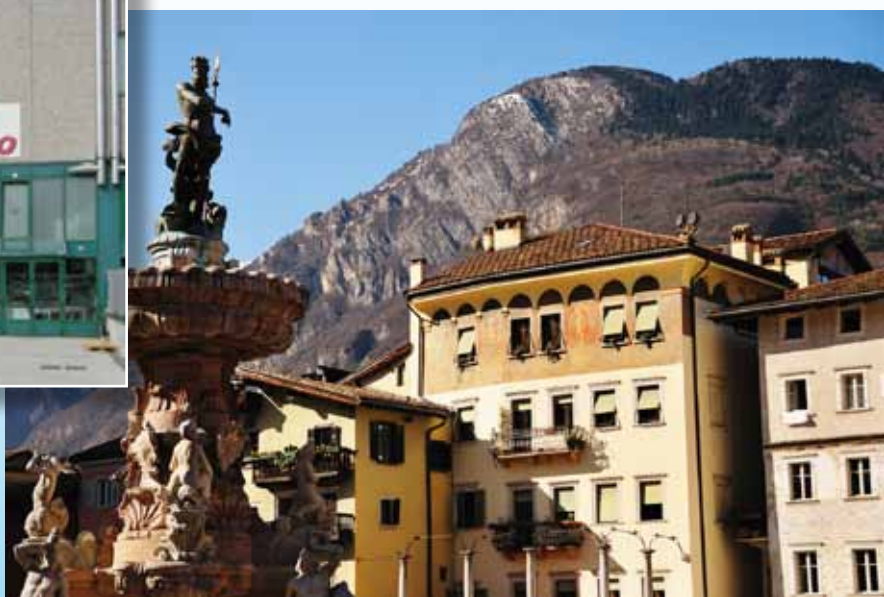
Piazza Duomo, Trento