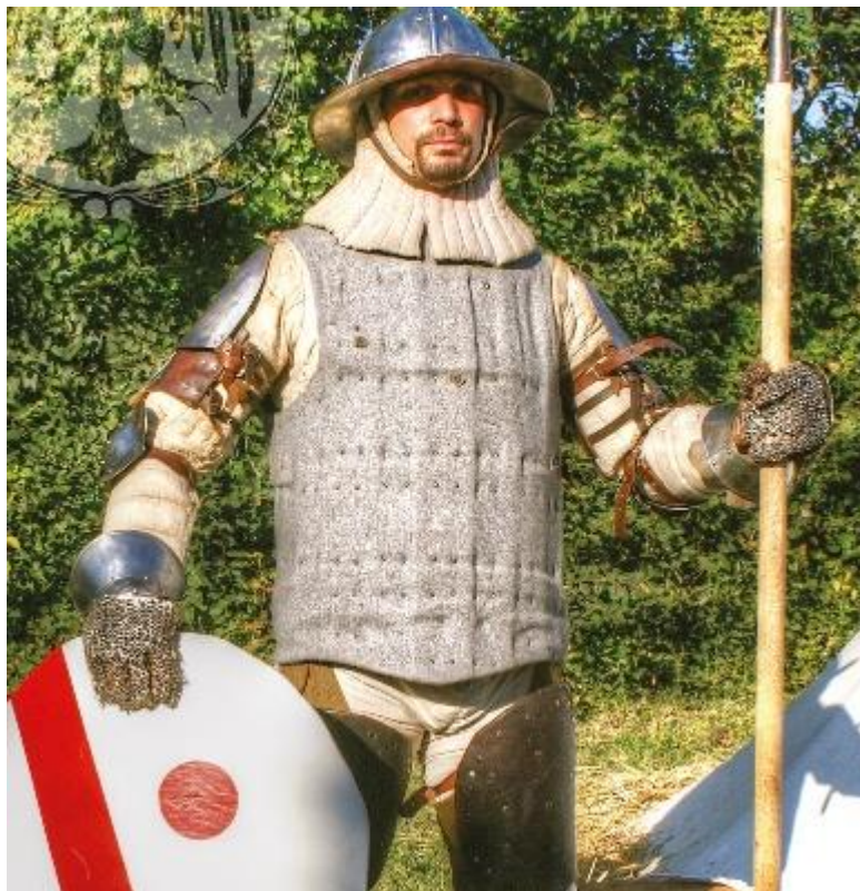
Civitas Alidosiana si è alleata con altri gruppi di rievocazione per dar vista all'odierna manifestazione dozzese

A DAR MAN FORTE agli organizzatori la Compagnia d'Arme Compagnia delle 13 Porte, la So-